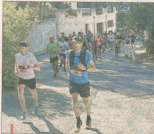
La huitième édition de la Calanquaise va se dérouler dimanche, au départ de la salle Lombardi au Rouet Plage.

Le parcours a été travaillé par les bénévoles de NWA Côte