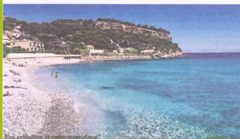
Eau cristalline et cadre magnifique

Également appelé plage des Tamaris, la plage du Rouet est assurément la plage de sable et galets la plus propice à la baignade, mais pas que... Carryens et visiteurs de passage apprécient également les équipements annexes qui en font un lieu unique pour se divertir et passer d'agréables moments. Suite à un réaménagement initié conjointement par la municipalité et la Métropole depuis quelques années, elle dispose d'un grand parking payant surveillé tout proche ainsi que de toilettes et de douches. Petite précision : le parking et la plage sont accessibles aux personnes à mobilité réduite.