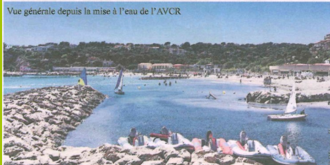
Vue générale depuis la mise à l'eau de l'AVCR

Enfin, pour terminer, comment ne pas citer la Société Nautique du Rouet Plage (SNRP), en charge du port abri du Rouet depuis plus de cinquante ans, qui anime les lieux pour le plus grand plaisir des plaisanciers. Voilà, le Rouet, c'est tout cela à la fois : du repos, du plaisir, des paysages, mais aussi et surtout un endroit où il fait bon vivre, doigts de pieds en éventail face à la grande bleue.