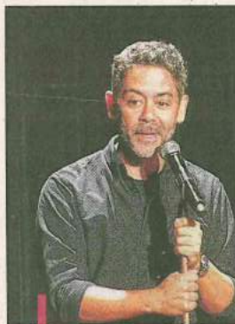
Excellente soirée en mode fous rires avec Manu Payet.

Manu Payet a parlé de lui et de sa vie. Toujours aussi énergique, il a transmis au public, durant 1h30, tout son punch. Il prend énormément de plaisir à jouer dans des salles intimistes pour être au plus proche: " À la Réunion, le Cari, c'est pas ça ! A Carry, après 14h, il ne se passe plus rien? Désolé je vous ai fait sortir un jeudi soir ", plai-