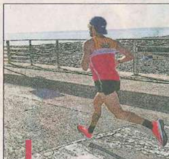
"Carro-Carry" et ses 14,27 km.