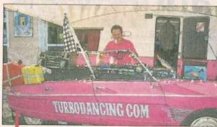
La radio éphémère de Turbodancing a été un formidable fil rouge.

"Un événement tendance, mode et déco vintage, faisant la part belle au spectacle vivant". C'était le concept du South vintage festival prévu jusqu'à dimanche au Théâtre de verdure à Carry. A la manœuvre, Ze Bourgeois, pétillante association essentiellement féminine, avait su donner en quatre ans, une vraie âme à l'événement, qui ressuscite le temps d'un week-end les mythiques sixties, si déjantées et si attachantes.