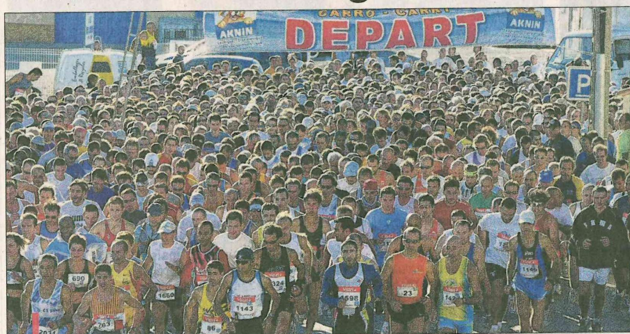
Le départ est donné ce matin à 9h30 de Carro. Dernière navette à 8h30.