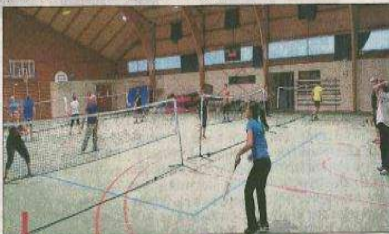
Les badistes se retrouvent deux fois par semaine au gymnase.

Les badistes prennent beaucoup de plaisir, selon leur niveau, à s'affronter lors de matches amicaux au sein de la section, le lundi de 18h30 à 20h et le mercredi de 8h30 à 10h dans le gymnase.