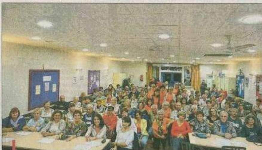
Salle comble pour l'assemblée générale de la Gymnastique Volontaire Côte bleue. Les adhérents ont rappelé leur attachement aux actions de l'association.