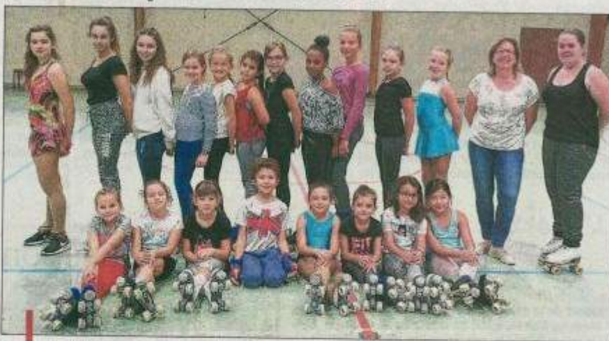
Les patineuses du Carry roller club effectuent une belle saison sportive. Un gala de fin d'année est d'ores et déjà prévu en juin prochain.