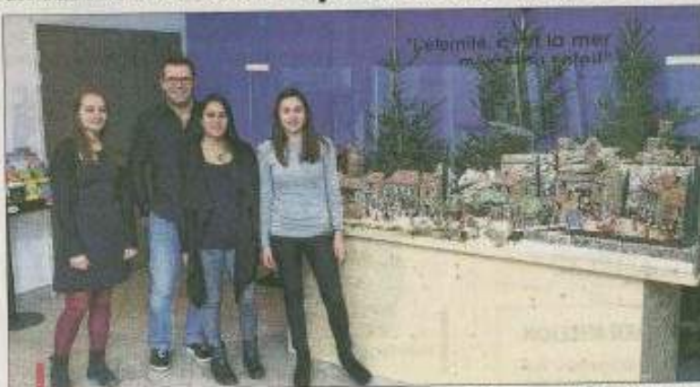
Depuis quelques mois l'office de tourisme se situe au 11 - 13 route Bleue, vous obtiendrez toutes les informations et renseignements qui valorisent la ville et ses acteurs.

Les visiteurs français et étrangers auront également accès aux listes des manifestations nocturnes et diurnes ; vous se-