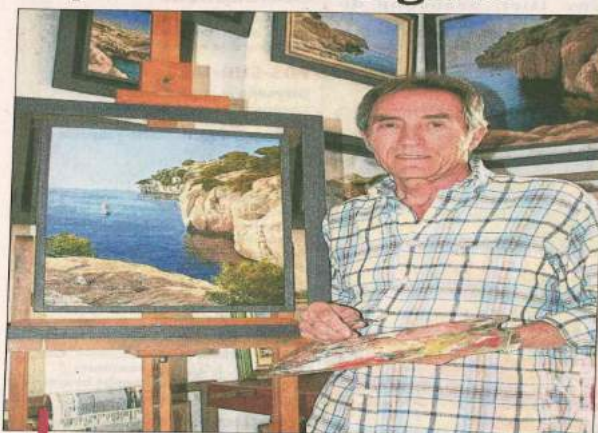
La première exposition de Michel Gaudin se déroule jusqu'au 7 juin à la Bergerie.