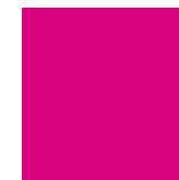
Y : Rose