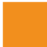
E : Ocre