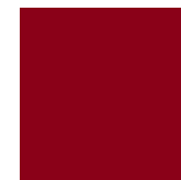
O : Bordeaux