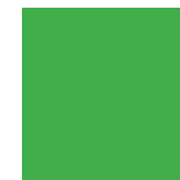
U : Vert