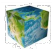
Z : Carré

➤ Continue ton chemin et chante une chanson en rapport avec l'eau