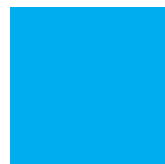
B : Bleu