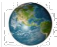
U : Ronde

(entoure la bonne réponse et reporte la lettre correspondant sur la dernière page)