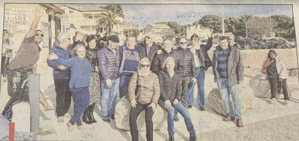
La coutume du premier bain de l'année a été respectée aux Calanquais de la Tuilière.

Les six plus courageux et téméraires ont pris le premier bain de mer. "L'an dernier l'eau était à 14 degrés, cette fois, à midi elle est à 16 degrés, l'air est un peu plus chaud mais la mer est agitée et pleine de posidonies. Ce bain c'est une coutume sympa, est bien vivifiant, raconte