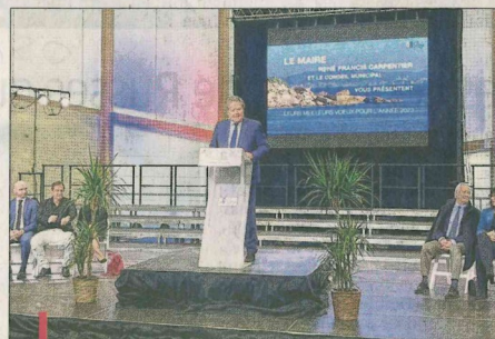
Entouré de seize élus, le maire a annoncé les projets de pôle jeunesse et de salle polyvalente.