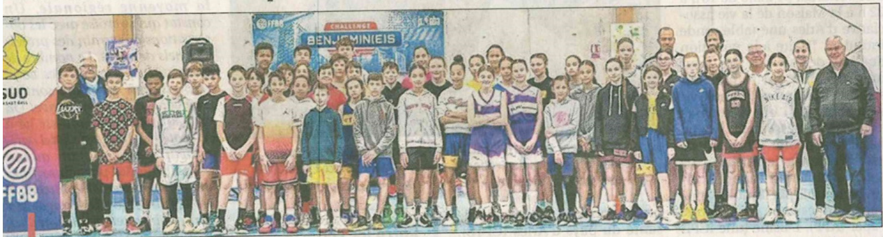
Réussite de la finale régionale du challenge benjamins U13 au complexe sportif de Carry-le-Rouet.