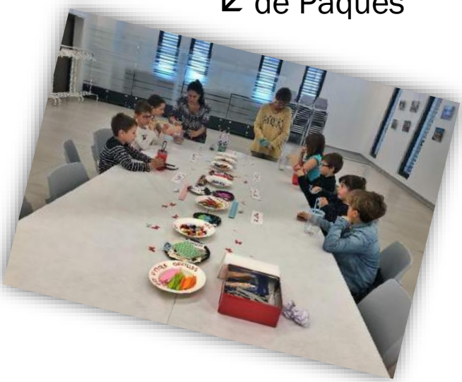
Ateliers créatifs ↳ de Pâques