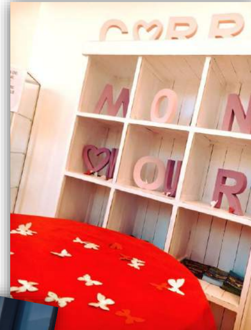
← Saint Valentin ↓