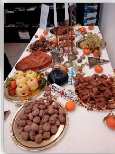
↑ Table des 13 desserts