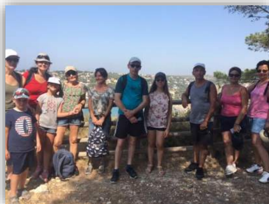
← Journées du Patrimoine