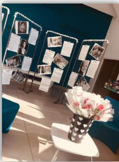
← Exposition Journée internationale des droits de la femme