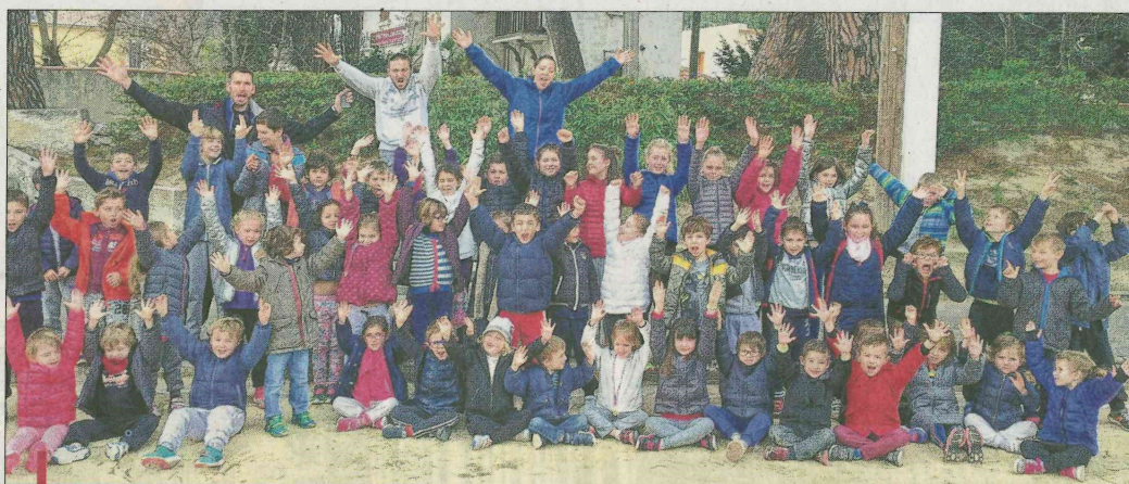
Newsport a proposé une large palette d'activités aux enfants et ados durant ces deux semaines de vacances.