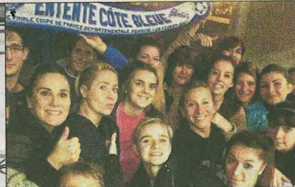
Les banderoles spécifiques n'auront pas suffi, malgré leur superbe parcours, les filles de l'Entente sont éliminées.

suenennes. Outre le scénario, l'Entente a subi "une ambiance détestable permanente" que les joueuses, les yeux rougis, disent avoir subie.