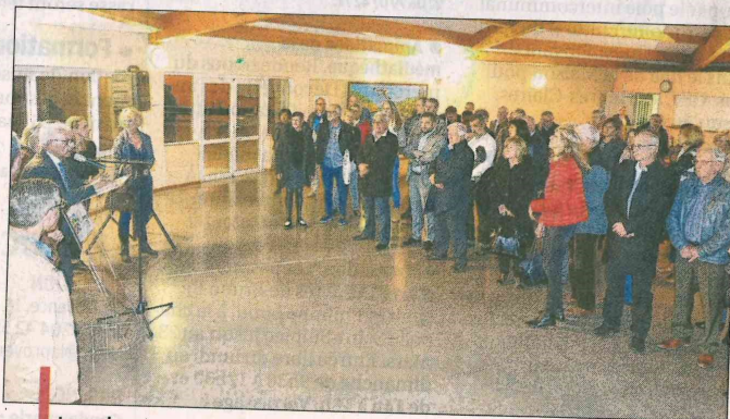
Le maire et son conseil municipal ont invité les acteurs de la commune à un pot de remerciement.

Un pot de l'amitié et un buffet convivial ont ensuite clôturé cette soirée remerciements et de partages.