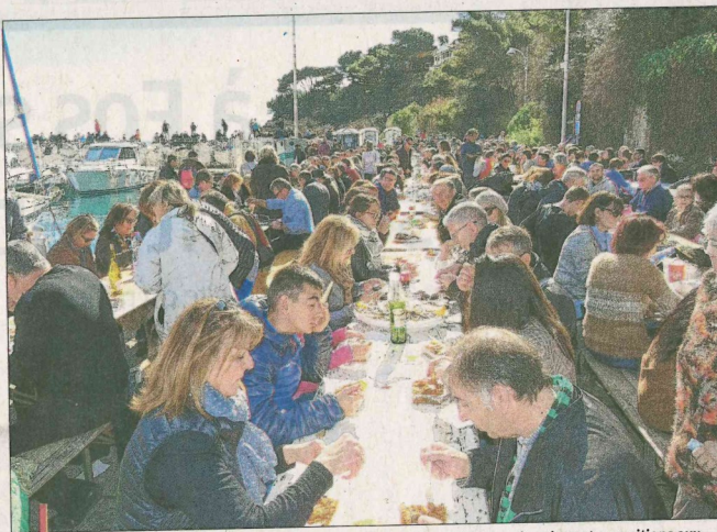
Le troisième dimanche des Oursinades proposera des dégustations, animations et expositions aux gourmands et gourmets dans une ambiance toujours aussi festive et amicale.

Sur le port, un marché des terroirs et artisanal regroupant pas moins de soixante stands proposeront leurs spécialités et conseils. Les restaurants mettront à la carte des menus "oursinades". En milieu de quai Vayssière, les touristes pourront découvrir une exposition de bateaux (par Nautic 2000). Ambiance musicale et anima-