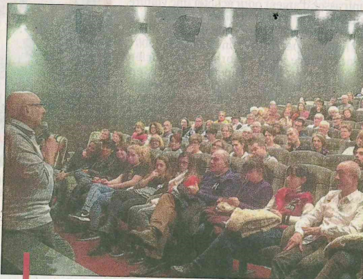
Les soirées à thème proposées par le cinéma Fernandel séduisent au-delà de la Côte bleue.