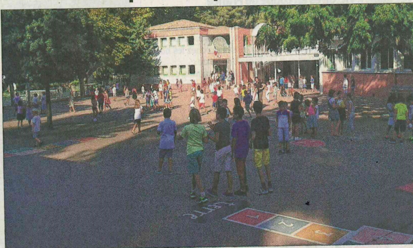
Les bénévoles de la Chrysalide vendront des brioches devant l'école aujourd'hui et jeudi à 16h15.

Les bénévoles de la Chrysalide seront présents au marché le vendredi matin afin de proposer leurs brioches pur beurre à partir de 9h. "Nous intervenons également pour sensibiliser les enfants et leurs familles, sur le parking des écoles ce mardi 4 et jeudi 6 octobre à 16h15 avec nos brioches. Nous espérons que de nombreuses personnes seront solidaires à notre action aux services des personnes