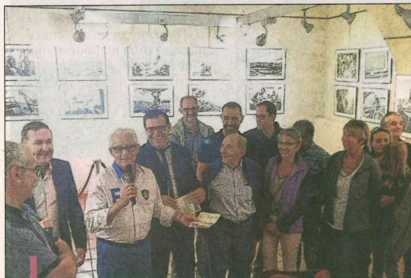
La deuxième exposition du salon d'art photographique ouvre ses portes au public jusqu'au 25 octobre.

La seconde exposition du Salon d'Art photographique vient d'ouvrir ses portes au public, salle de la Bergerie, organisée par l'association Photo Club Carry Côte bleue et la municipalité.