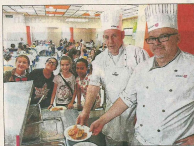
Le repas servi par les chefs, a permis d'éveiller les enfants au goût des bonnes choses et découvrir d'autres saveurs.