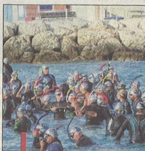
500 concurrents se sont affrontés sur un parcours en boucle (3 km).

Nouvelle réussite, pour la deuxième édition de la course à la nage "La Traversée", compétition aquatique organisée par Côte Bleue Passion dans le cadre de Septembre en Mer. Cinq cents concurrents ont pris le départ de la plage de sable du Rouet Plage, en catégorie palmes, mono palme, sans palme et planche rescue. Par sécurité et en raison de fortes rafales de vent, le parcours de secours a été sélectionné par les organisateurs (3 kilomètres en deux boucles de 1,5 kms uniquement dans la baie du Rouet). Le plan d'eau pour la course était sans vague. Un public nombreux a suivi les sportifs et les a félicités aux arrivées. Le parrain de la compétition, le champion Frédéric Bousquet était présent tout au long de cet événement. "Je suis très heureux et fier d'être présent et de parrainer la Traversée, une manifestation sportive liée à ma passion et par le biais d'une ancienne nageuse et amie Mandine. L'idée et le concept sont hyper-intéressants, c'est une