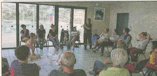
Le premier café-parents de la saison a attiré de nombreuses personnes, salle Roger-Grange.