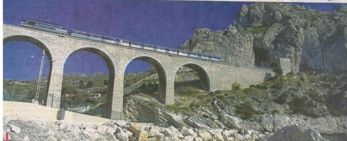
La ligne de la Côte Bleue est un véritable bijou mais, au-delà de son aspect pittoresque, reste un outil de travail pour beaucoup d'usagers qui l'empruntent.

Le collectif "Un train pour un investissement d'avenir" a évoqué les problèmes de cette ligne