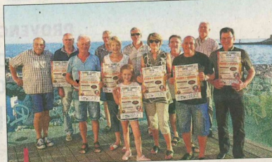
Les responsables des bénévoles se réunissent pour peaufiner l'organisation de la deuxième course du département.

La date limite des inscriptions est fixée à aujourd'hui, jeu-