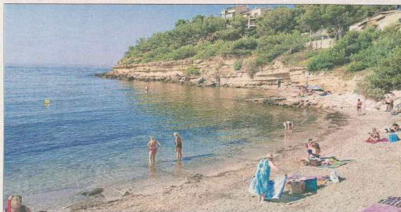
Du sable, des galets, des poissons, une eau limpide... Il est là, le bonheur !

La plage de Carry accueille touristes et locaux dans une mer limpide