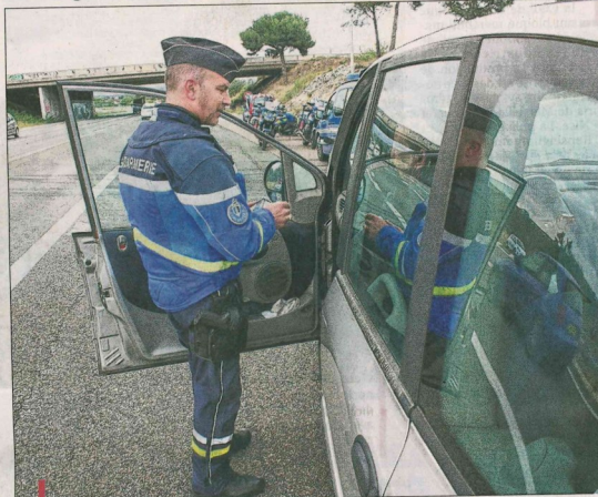
Les gendarmes, informés par leurs collègues placés 1 km en amont le long de la RD9, ont arrêté de nombreux conducteurs, hier, en excès de vitesse.

42 Le nombre d'infractions à la vitesse enregistrées hier, entre 7h et 9h.