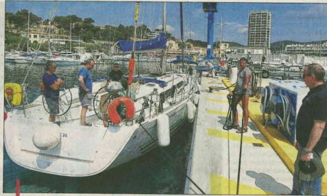
Les premiers bateaux viennent faire le plein. Les plaisanciers sont enchantés de pouvoir s'arrêter à nouveau dans le port de plaisance.

Montagnac, après avoir parlé de la création et des aménagements du port il y a trente et un ans, a souligné qu'au départ, "les nuisances et les travaux étaient difficiles à accepter pour les usagers du port, mais au final ils vont disposer d'une superbe aire de carénage moderne. La Métropole apporte un plus à la population et aux usagers du port et de la mer. C'est un port à la taille de notre ville, le mariage avec la Métropole ne s'est pas fait sans douleurs, il a été contraint et forcé, avec des hauts