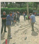
Le concours vétérans a attiré 72 joueurs sur les terrains de la Pétanque Carryenne.

Les boulistes et amateurs de pétanque et de jeu provençal pourront ainsi s'adonner à leur passion en tant que joueurs ou bien spectateurs avec de nombreux concours officiels lancés depuis le printemps et jusqu'à la fin de la saison estivale.