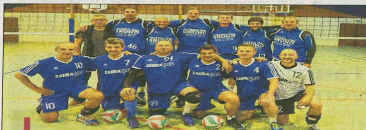
Le Côte Bleue Volleyball est invaincu cette saison.