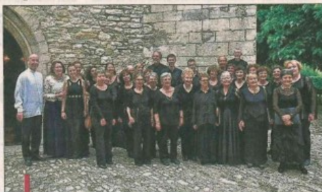
Le Chœur Carryssimo va se produire en l'église de la commune ce dimanche après-midi.