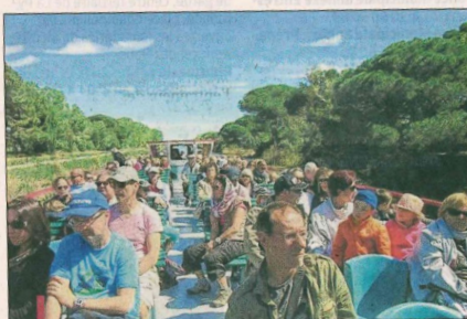
L'Entraide Solidarité 13 de Carry a fait escale à Aigues Mortes avant de prendre la direction de La Clotat mi-mai.