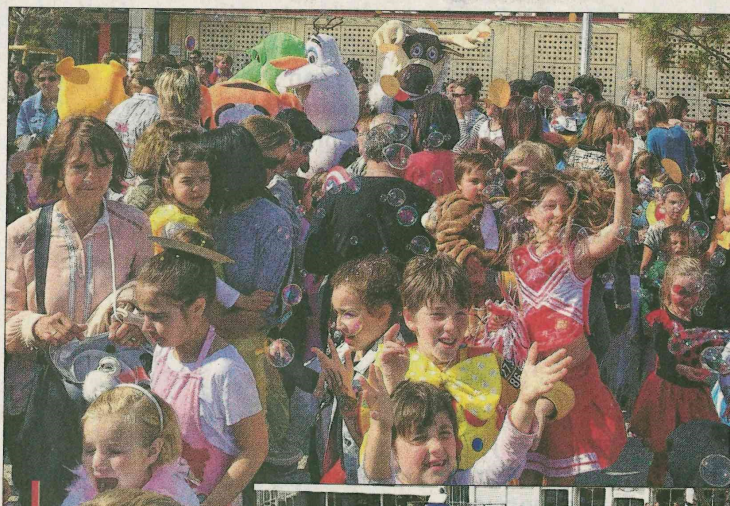
Danses, chants, jeux et batailles de confettis pour petits et grands sur l'esplanade du port.

Sur place, jets de confettis et bulles les ont accueillis au son des tubes du moment. Le port est devenu un lieu très festif et animé, un grand goûter et des friandises ont été offertes aux