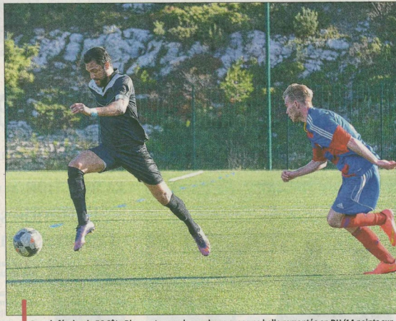
Depuis février, le FC Côte Bleue retrouve des couleurs avec une belle remontée en DH (14 points sur 16) et pour la première fois une qualification en demi-finale de la coupe de Provence.