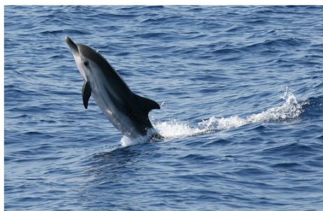
Illustration d'un dauphin bleu et blanc.

Une macabre découverte pour des promeneurs du dimanche matin qui se baladaient tranquillement sur le littoral... Un dauphin s'est échoué sur le rivage de la calanque des Eaux Salées, à Carry-le-Rouet, rapporte La Provence . L'animal faisait environ deux mètres de long.