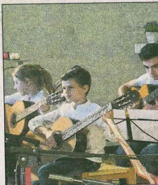
L'AOCR se mobilise pour la deuxième édition du concours internationale de guitare.

Les concerts organisés par l'AOCR en l'église de la commune sont désormais gratuits. Une libre participation au défraiement des musiciens est proposée au public. Le bureau de l'AOCR espère que cette dis-