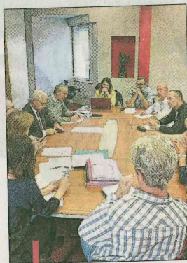
Le maire a reçu les présidents de clubs pour écouter leurs doléances.

Pour ces présidents de club, il est important de disposer d'un gymnase chauffé, de vestiaires non mixtes avec de douches réglables en température, des tribunes accessibles à