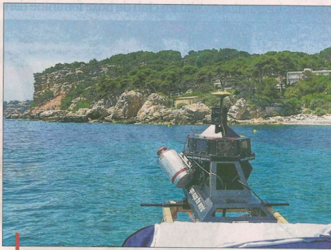
L'évaluation de l'érosion se fait avec un scan laser embarqué qui assure le suivi.

L'érosion du littoral a toujours existé. Mais en raison de son long travail de sapes sous l'action de la mer, du vent, des variations climatiques et des précipitations, les hommes n'en ont pas conscience. Eux qui, de surcroît, peuvent s'avérer facteurs de dégradation de par l'arrosage ou les piscines. Si les choses semblent évoluer aujourd'hui, c'est parce que 27% des côtes françaises métropolitaines s'érodent et que cela se ressent. Sur la façade atlantique bien sûr, mais également sur celle méditerranéenne. Les exemples ne manquent pas de cette érosion qui s'acharne sur les plages et les falaises. En témoignent pour les événements plus marquants, les effondrements intervenus sur le territoire de la commune de Carry-le-Rouet en février 2008, lorsque 50 mètres de falaise sont partis à l'eau (lire ci-dessous). Ou encore en avril 2015, lorsque des dizaines de m 3 de terre et de roches sont venues encombrer le quai Maleville du port. Autre