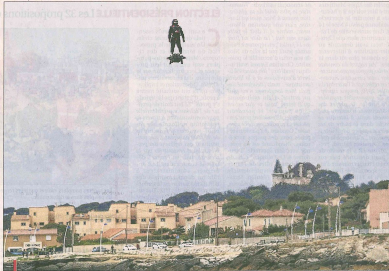
L'homme volant lors de son spectaculaire record du monde de distance établi entre Carry et Sausset en avril 2016.