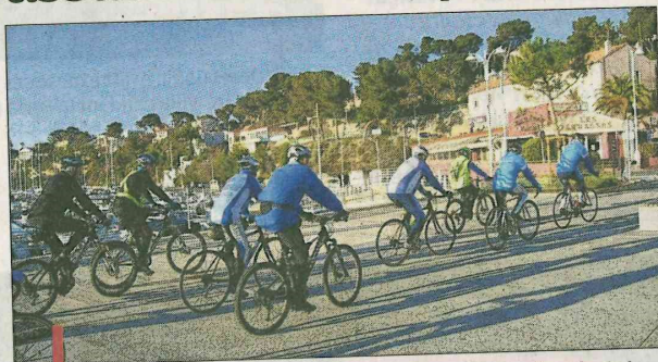
Dimanche venez participer à la 32 e édition de la randonnée de la Côte Bleue et des calanques organisée par le vélo-club.

Informations et inscriptions sur le site : http://club.quomodo.com/cotebleue/ Inscriptions de 7h à 9h à Sausset.