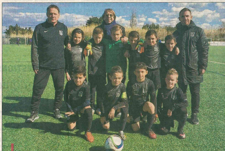
Claude Leroy pose avec les jeunes U10 du FCCB. Une photo souvenir pour une belle journée aux côtés de l'ancien sélectionneur du Cameroun notamment.

Il a pu apprécier les qualités des jeunes du FCCB qui se sont qualifiés pour la finale à huit équipes du challenge au même titre que le FC Châteauneuf les Martigues dans l'autre poule. "Ce fut un super moment. Il a pu échanger avec les enfants, leur rappeler notamment sa carrière", évoque Videira qui a croisé la route de Leroy au PSG puisqu'il a quitté le club de la capitale en 1996 alors que Leroy