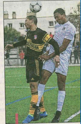
Les joueurs d'Osama Haroun, ont encore été surpris à domicile.