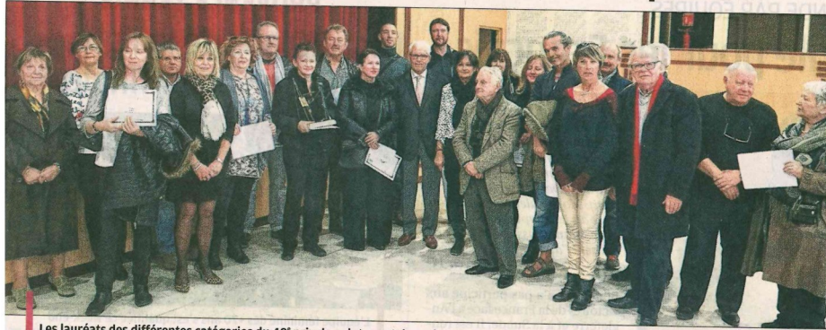
Les lauréats des différentes catégories du 48 e prix de peinture et de sculpture de la ville entourés des membres du jury et des élus.

De nombreux artistes et passionnés d'art, ont assisté au premier jour d'exposition, au vernissage et à la remise des distinctions du 48 e grand prix de peinture et de sculpture de la ville. Cet événement artistique est partagé entre la salle d'exposition la Bergerie, lieu de passage incontournable de nombreux peintres locaux, régionaux et internationaux et la grande salle de l'espace Fernand.