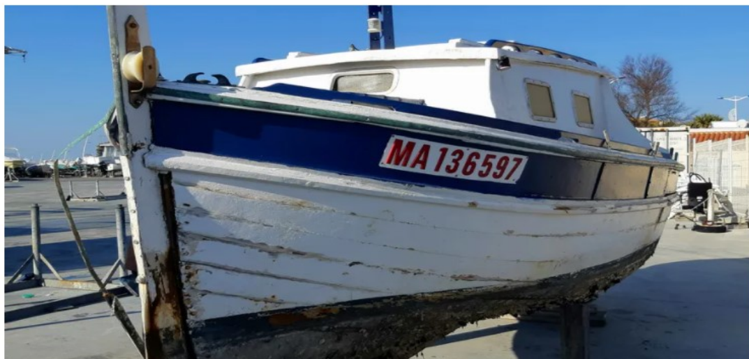
Le "Caméra" bateau de Fernandel va être réparé avant d'être exposé à Carry le rouet

L'acteur et chanteur de l'après-guerre possédait une maison à Carry-le-Rouet (Bouches-du-Rhône). Grand amateur de pêche, il aimait partir en bateau pendant de longues heures depuis sa maison située juste au-dessus de la mer, sur la Côte bleue.