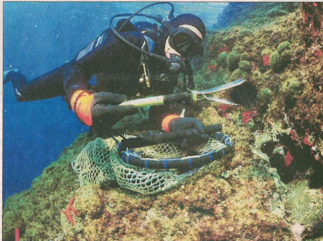
La pêche aux oursins, très réglementée, fermera le 15 avril. L'organisation d'oursinades d'ici là reste soumise à de multiples interrogations liées à la pandémie.

Carry, premier village de la région à avoir lancé ses oursinades,