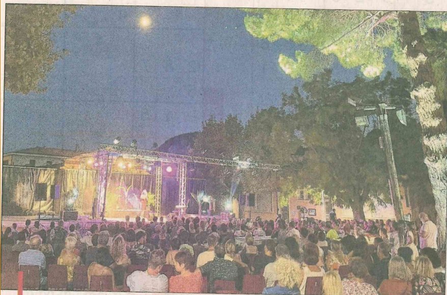
400 spectateurs ont pris part à l'édition 2022 du concours de chant au théâtre de verdure.

Le concours de chant s'est déroulé devant 400 spectateurs