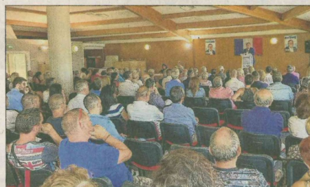
À Carry, le député sortant a martelé son héritage, droit au but, s'avançant comme le candidat "de la proximité".

Le ton sera plus musclé à dénoncer "la fake news de Jacques Clos-