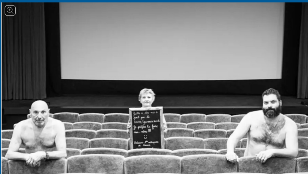
Le président du cinéma Fernandel, sa directrice et l'un des deux projectionnistes, avaient posé "à poil".

Frappé de plein fouet par la crise sanitaire, le cinéma de l'espace Fernandel, lieu de vie et de culture indispensable sur la Côte bleue, tente de résister face aux nombreuses difficultés