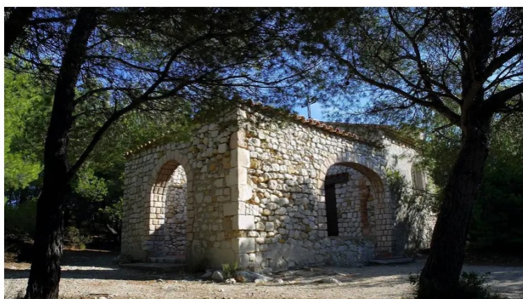
Au delà de la chapelle, un coin reposant avec une jolie pinède avec vue imprévisible sur Marseille et la baie du Rouet.