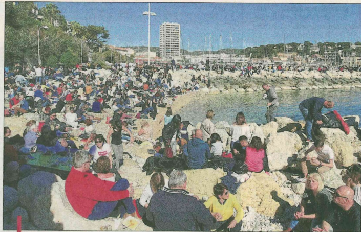
La plage Fernandel a été prise d'assaut par les visiteurs.

Ce dimanche on roulait donc au pas dans Carry. Autour du port, on marchait également au pas et pour accéder aux stands, il fallait jouer des coudes mais c'est là toute l'ambiance des oursinades. Comme toujours, la fête était au rendez-vous sur les quais, autour des stands, des tables, sur les digues, sur la plage ainsi qu'aux terrasses des restaurants. Les poubelles servaient même de comptoirs pour certains gourmands. Populaire, chaleureuse et bon enfant, la fête a donc été une nouvelle fois une belle réussite. Les touristes venaient de partout en bus, en voiture ou en train, comme ce groupe originaire du Gard et de l'Hérault. "On vient tous les ans ici, vous avez nos coquillages sur vos étals mais vos oursins sont bien meilleurs! C'est l'occasion de se retrouver