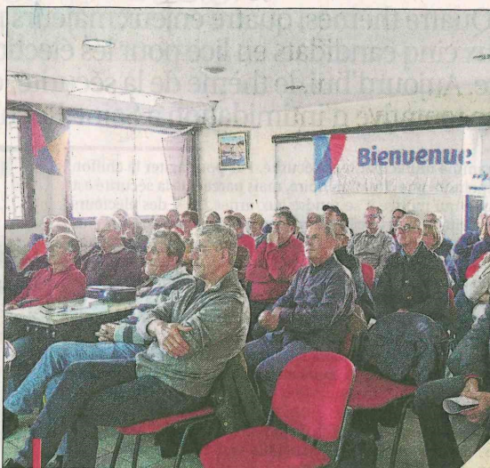
L'assemblée générale a rassemblé une centaine de personnes à l'espace Roger Grange.