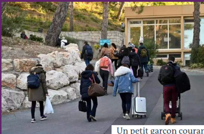
Des personnes mises en quarantaine quittent Carry-le-Rouet, le 14 février.

Après quinze jours confinés dans les Bouches-du-Rhône, ils louent une « expérience humaine incroyable » et aspirent à retrouver une vie normale.