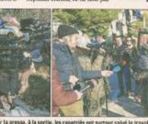
Il n'y a pas de contact avec l'extérieur, raconte un Français. À Wuhan, il n'y a plus aucune circulation de véhicules. C'est plus de pollution. Le brouillard est permanent. C'est la fin de la vie. C'est la fin de la vie.