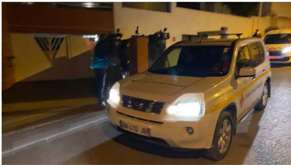
Quatre rapatriés ont quitté Carry le Rouet à bord de voitures de la Croix Rouge

La quarantaine des 180 Français de Wuhan à Carry-le-Rouet (Bouches-du-Rhône) est terminée. Les rapatriés sont partis ce vendredi matin après avoir passé une soirée d'adieux en chansons.