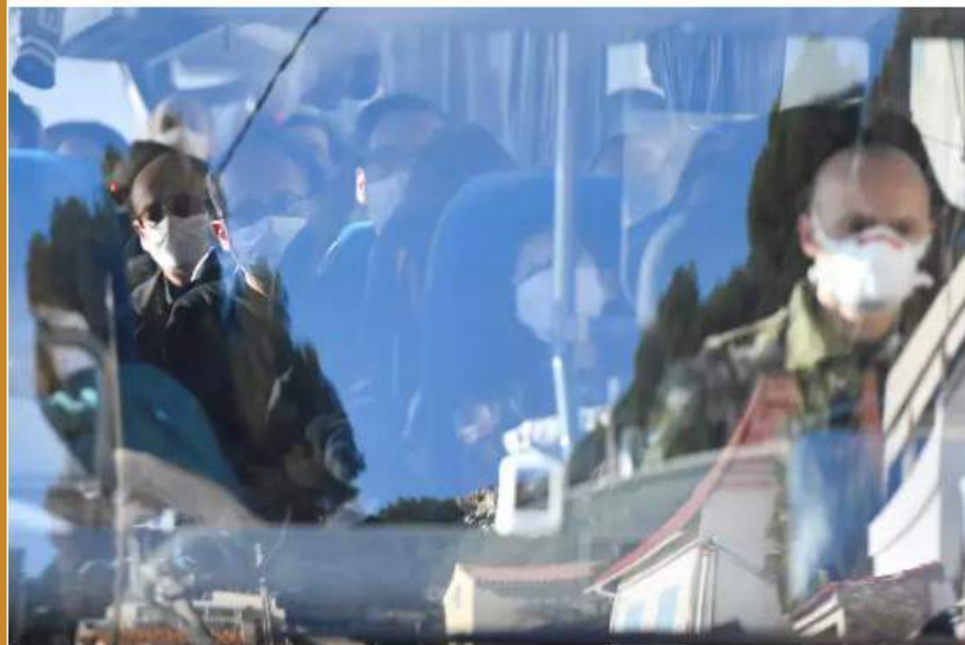
Des citoyens français évacués de Wuhan arrivent par bus à Carry-le-Rouet, près de Marseille, le 31 janvier.

Alors que l'atmosphère s'est apaisée autour du centre de vacances des Bouches-du-Rhône où 180 rapatriés de Wuhan, foyer du nouveau coronavirus, ont été placés en quarantaine, un deuxième lieu de confinement a ouvert dimanche, à Aix-en-Provence.