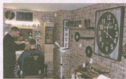
Barber Lounge – 1 Chemin des Diligences