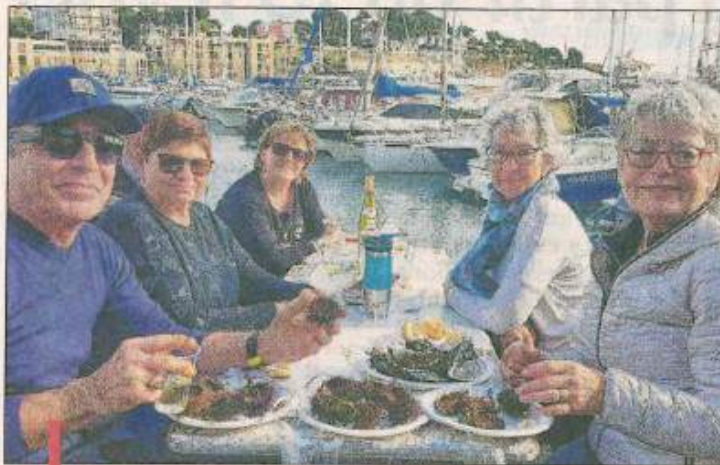
L'ouverture du mois de l'oursin a réuni des milliers de gourmands, hier, à Carry-le-Rouet.