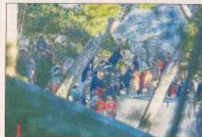
Au centre de vacances Vacancier, les Français prennent leur mal en patience. Ils y resteront confinés jusqu'au mi-février.