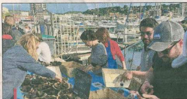
Le soleil devrait être de la partie, demain, sur le port de Carry!

Ce deuxième dimanche des Oursinades sera une journée festive dans la capitale historique de l'échinoderme. Depuis plus de 60 ans, ce qui fait la popularité de cet événement majeur pour la ville, c'est l'ambiance des plus chaleureuses et amicales qui y règne. Les amateurs de fruits de mer, les gourmands et les gourmets se donnent rendez-vous à Carry-le-Rouet pour déguster en famille ou entre amis les succulentes gonades iodées des oursins, accompagnées de lichettes de pain et de vin blanc, mais aussi les autres coquillages présents. Le côté convivial, le partage et les échanges, les fous rires entre gourmands et gourmets, sur les quais, les digues, plages et le long des terrasses fait la différence entre les oursinades de la