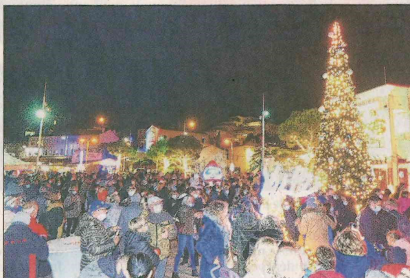
Les habitants étaient nombreux samedi soir pour le lancement des illuminations de Noël en ville.

Le maire a ensuite rappelé que les festivités de Noël se dérouleront jusqu'au 3 janvier, durant un mois : marché, grands manèges, présence du père Noël, défilé lumineux, crèche à l'office de tourisme, feu d'artifice, expositions, petit train, parade, poney, animations musicales... "La magie de Noël enchante notre commune, nous comptons participer à vous faire vivre des fêtes de fin d'année in-