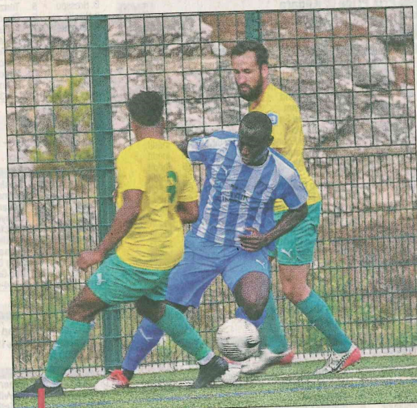
Le FCCB, séduisant à souhait, a su s'extirper du piège cannois à trois minutes de la fin.