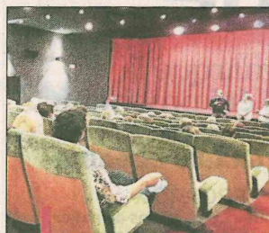
Le CCAS et ses partenaires organisent la Semaine Bleue pour les seniors.

Mercredi 7 octobre, séance de cinéma en partenariat avec le ci-