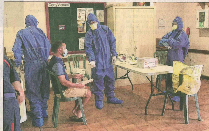
Le Département organise des tests de dépistage itinérants. Lundi c'était à Carry, lundi prochain ce sera à Martigues et mercredi à Istres. C'est gratuit mais il faut prendre rendez-vous.

Pour assurer au mieux la sécurité sanitaire dans les collèges, à quelques jours de la rentrée scolaire, le Département, en partenariat là encore avec le Sdis13 et avec l'appui du Laboratoire départemental d'analyses (LDA), a mené entre le 25 et le 28 août une grande opération de dépistage à destination