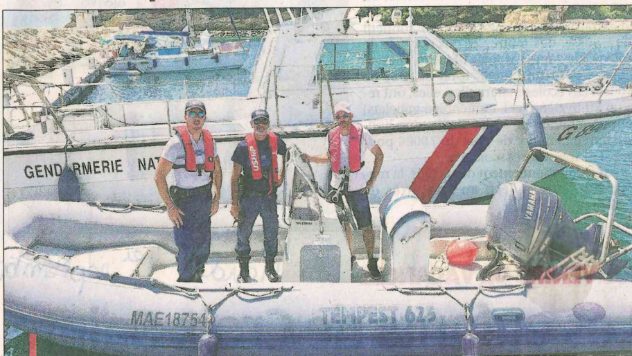
Ces patrouilles maritimes mixtes seront reconduites jusqu'à la fin de la saison estivale et ces collaborations étroites entre la police municipale et les agents portuaires vont s'intensifier jusqu'à la fin de l'année.

"Dans le cadre des pouvoirs de police du maire, leurs missions sont d'assurer la sécurité de la baignade dans la zone des 300 mètres qui longent nos côtes, indiquent les deux élus Carryens, mais aussi pour faire respecter la réglementation dans la zone protégée du Parc Marin entre le Rouet et le port de plaisance. Avec la présence des agents de la Métropole, ils disposent d'un pouvoir de police spécial, ils sont aussi en mesure d'assurer la surveillance des deux ports de la station de tourisme classée, de leurs accès et des chenaux, des mises à l'eau associative de la Tuilière, et publique du port (interdite entre 10h et 17h), le respect des cinq nœuds dans la bande des 300