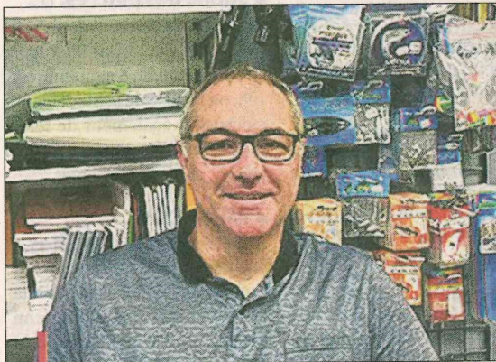
Denis propose un large choix de matériel et d'appâts de pêche

Carry Presse, tel: 04 42 45 01 18/19 Côte Bleue/ouvert tous les jours de 7 h 30 à 12 h 30 et de 15 h à 19 h en semaine, 7 h 30 à 19 h le week-end.