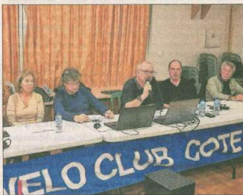
Les rendez-vous des mois à venir sont nombreux et ont été annoncés de cette assemblée générale.

Parmi les points noirs, le constat unanime par nos rousleurs de l'augmentation des décharges sauvages que les élus locaux ont bien notée, promettant d'être vigilants et de remonter les infos. Mais le club