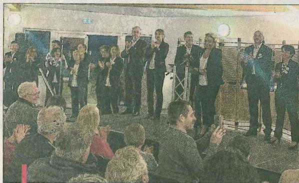
Mars, c'était le temps du dernier meeting avant le 1 er tour.