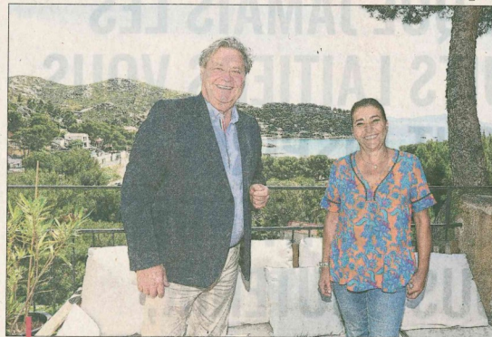
Adversaires hier, les deux candidats regardent dans le même sens pour le 28 juin.

Je suis satisfait des résultats sans oublier qu'il y avait un contexte particulier. Cela a d'ailleurs peut-être joué sur les électeurs, au vu de la participation. Ces résultats, plus ou moins équilibrés, sont une preuve de plus de la nécessité de cette campagne électorale pour faire face à un déni de démocratie. Une Mairie ça se gagne, on n'en hérite pas. Les résultats ont confirmé cette évidence.