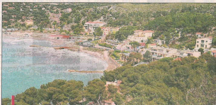
Si Sausset ouvrira dès lundi, la plage du Rouet hissera le drapeau vert le 30 mai.

Dans le plan de bataille, la municipalité - qui a milité aussi pour la réouverture du centre de