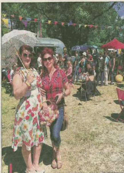
La mode sera au vintage ce week-end à Carry.