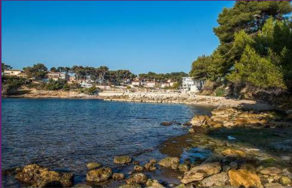
Calanque du Cap Rousset

La plage du Rouet est sans doute la plus populaire - et la plus « civilisée » - de la côte. Déjà parce que c'est la plus grande près de Carry. Ensuite, parce que ses qualités la rendent aimable auprès de tous les publics. En plus d'être un bon spot de surf, de voile et de paddle, on y trouve des transats à gogo, déployés sur une partie sable, une partie galets. Pour ne rien gâcher, elle forme une anse naturelle couleur turquoise (oui, on se répète !).