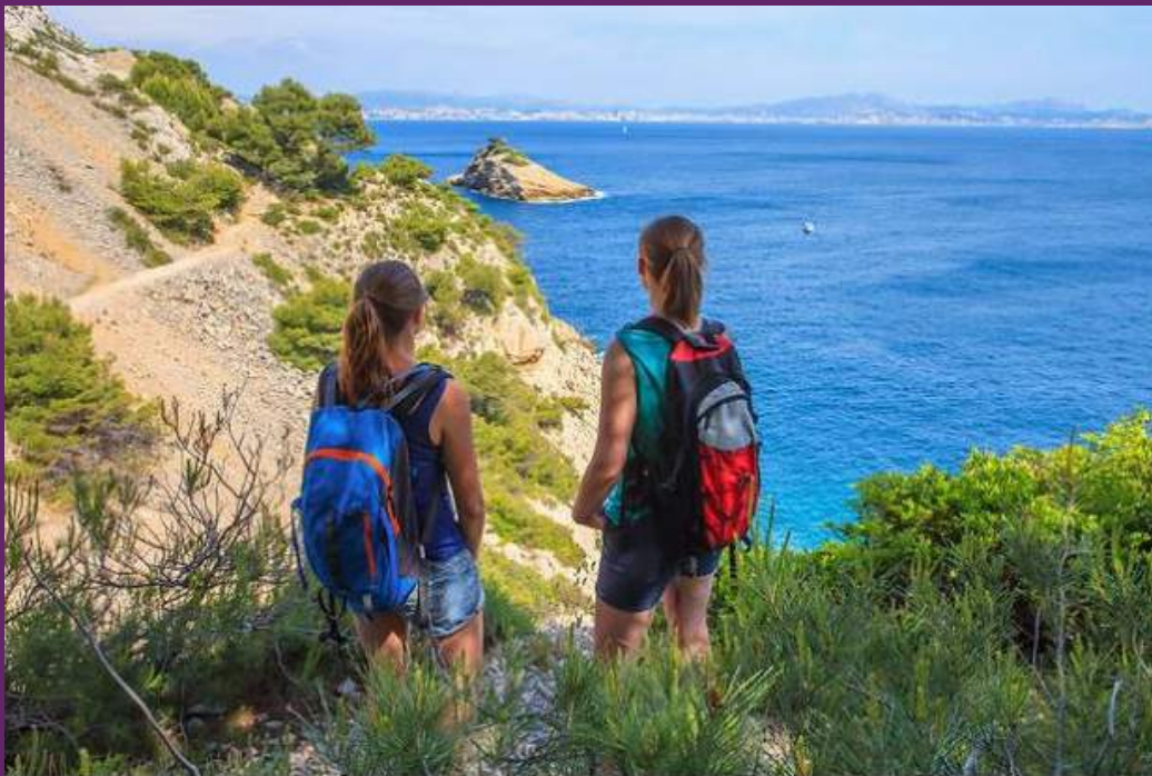
Randonnée le long de la Côte Bleue