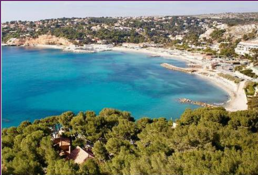
Plages du Rouet

Peu hospitalières au premier abord, les plages de la Côte Bleue sont faites de galets et leurs eaux ne sont pas avares en oursins. On vous recommande vivement de prévoir des chaussures de plage.