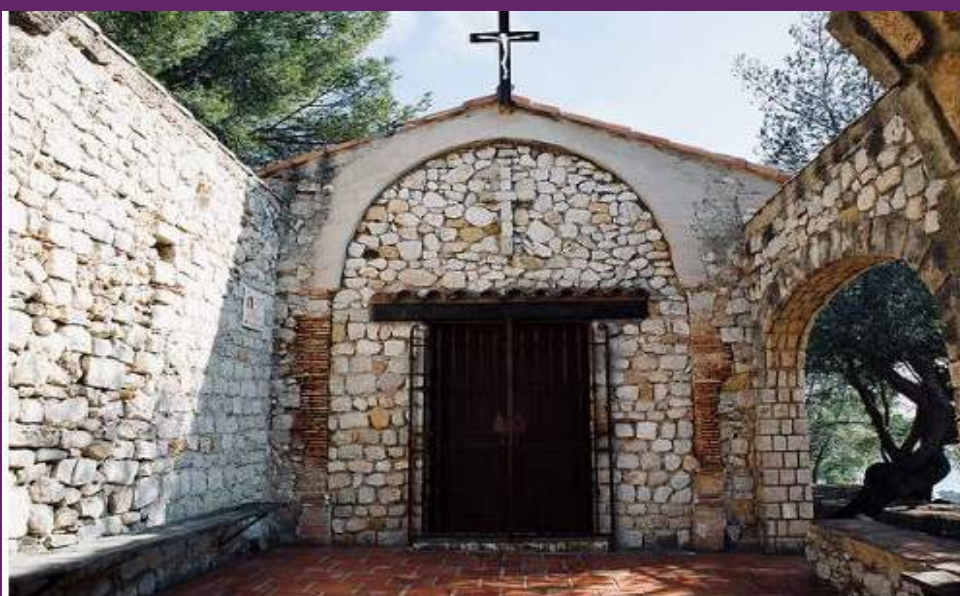
Chapelle Notre-Dame du Rouet

Plus que la jolie vue sur Marseille, au loin, on retient de cette promenade le puissant parfum des figuiers venu nous surprendre de temps en temps. Sur le chemin, on peut se rafraîchir dans la calanque des Pierres Tombées , un spot entouré de falaises ocre et d'une végétation dense connu pour la clarté de ses eaux. Quand le mistral souffle, les vagues fouettant les rochers offrent un spectacle tout aussi magnifique.