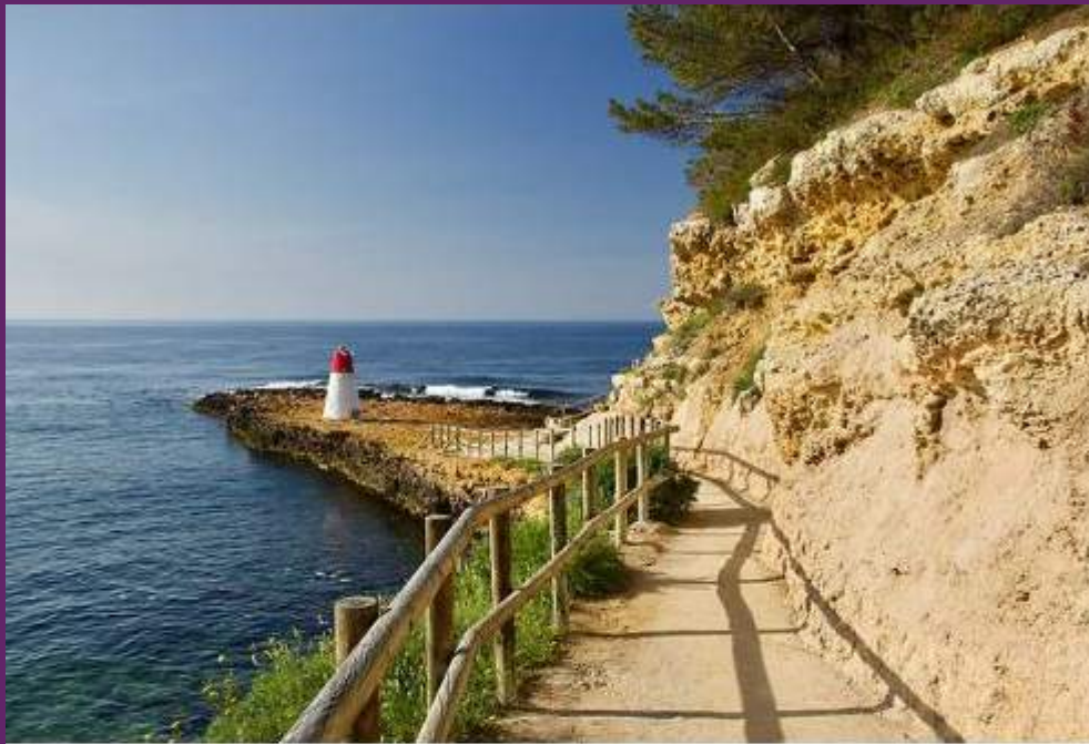
Sentier du lézard

C'est un bon point de chute pour explorer la Côte Bleue. Et d'ailleurs, nous ne sommes pas les seuls à le penser... Né à Marseille, l'acteur Fernandel avait choisi Carry-le-Rouet comme cadre de villégiature à partir de 1939. Il y avait fait construire une maison, qui appartient aujourd'hui à des particuliers. On la voit toujours surplombant le port : c'est la bâtisse jaune avec des volets blancs, au-dessus de la plage qui porte son nom.