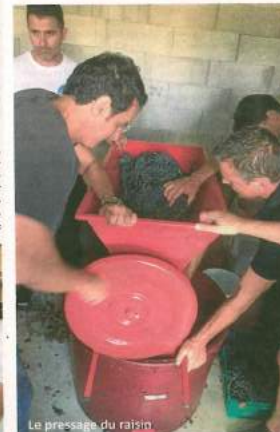
Le pressage du raisin

L'abus d'alcool est dangereux pour la santé. A consommer avec modération.