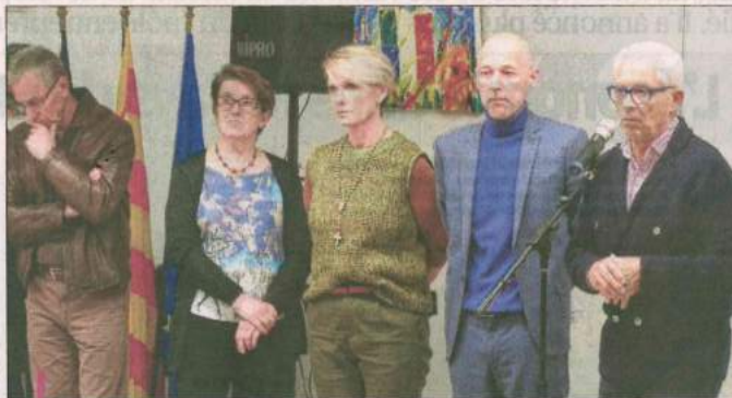
Le directeur général des services et le maire ont souhaité leurs vœux aux agents territoriaux.