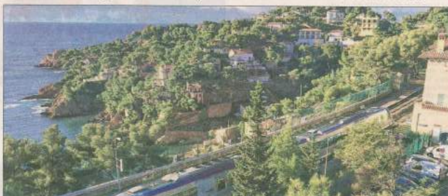
C'est la partie de la ligne comprise entre l'Estaque et Carry-le-Rouet qui va être rénovée dans un premier temps.

Un véritable soulagement pour les usagers, dont le nombre varie entre 1300 et 1500 par jour, alors qu'il était encore plus de 2000 il y a quelques années. Mais les réductions de vitesse mises en place par la SNCF sur la partie la plus dégradée, et un allongement du trajet, assorti de quelques incidents interrompant le service, en ont découragé plus d'un. Après de premières annonces positives en début d'année, qui suivaient une période de fortes inquiétudes (Lire La Provence du