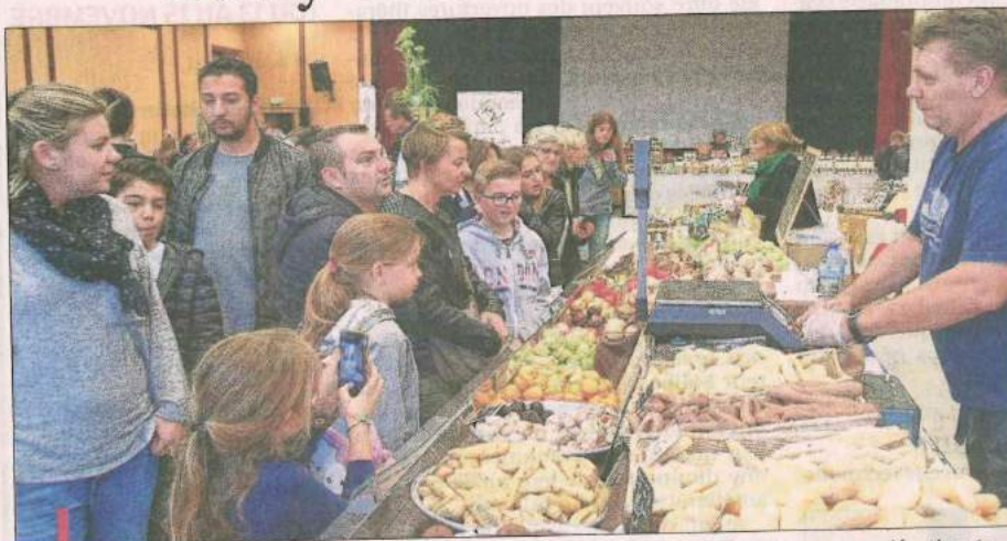
Le salon du chocolat, organisé par le Rotary Carry Côte Bleue, est à déguster sans modération. Le chocolat sera présent sous toutes ses formes et recettes.