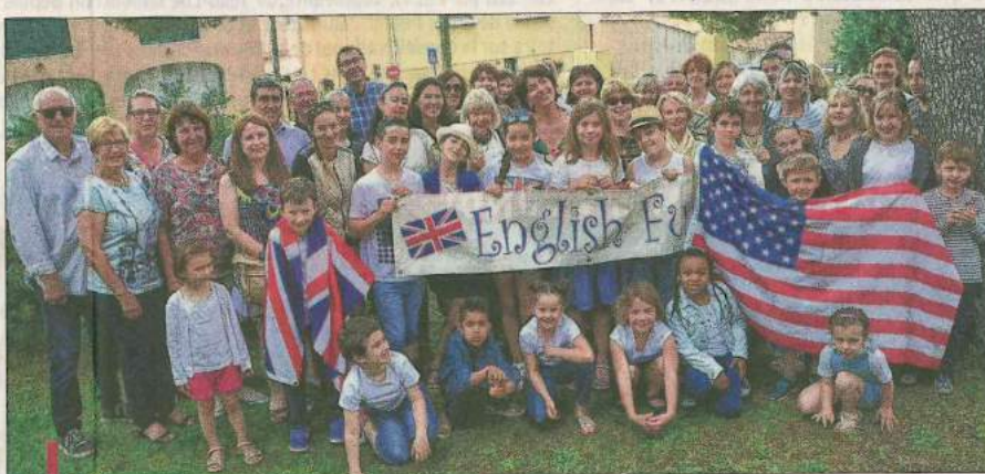
Les joyeux lurons d'English fun, ici lors de la fête de fin d'année.