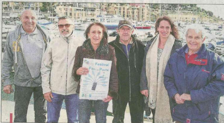
Ce dimanche à 10h30 au cinéma, les organisateurs lanceront le premier festival du film de poche sous la présidence de Gérard Meylan.

"Outre la projection du film et la remise des prix décernés, ce premier festival, a trois objectifs: permettre aux ados des deux communes de mieux se connaître, de partager leurs diffé-