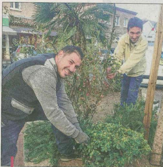
Les illuminations de Noël sont en cours d'installation dans la commune, lancement des festivités ce samedi 17h30.

Les nombreux sujets de toutes tailles (dont des nouveaux comme sur l'avenue Pierre Sénard et son allée de pins) de diverses couleurs, qui apporteront