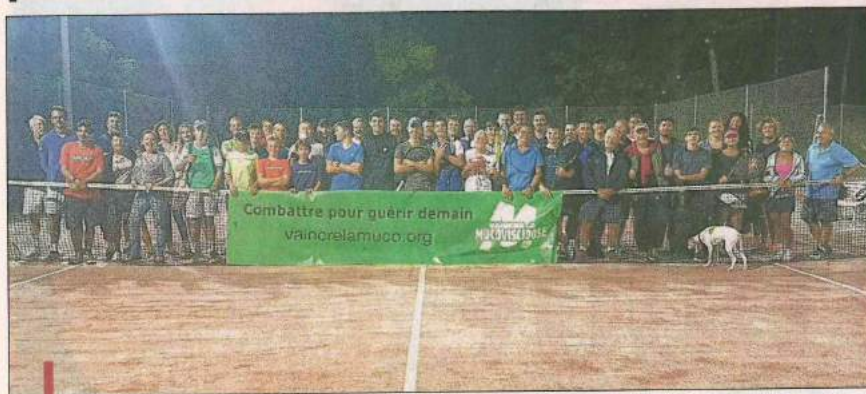
Le Tennis Club Carry a participé aux Virades de l'Espoir 2017.