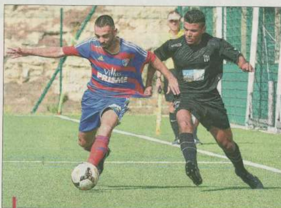
Les joueurs du FC Côte Bleue ont reconnu la supériorité de l'adversaire du jour qui a concrétisé sa domination par deux buts.