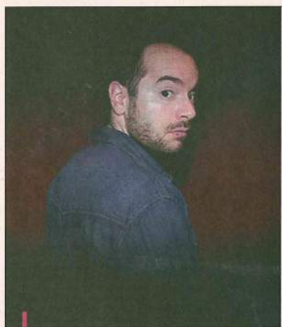
Kyan Khojandi clôturera ce soir le festival d'humour de Carry-le-Rouet.