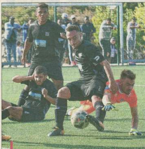
Le FCCB, tenu en échec dimanche dernier sur sa pelouse, peut se racheter en coupe de France.

dran estime pour sa part que "le groupe trouvera son rythme de croisière durant le mois de novembre, une fois que les joueurs auront trouvé leurs marques et que les blessés et suspendus auront tous réintégré le groupe. En attendant, il faut faire le dos rond et continuer à travailler avec humilité. Mais cet après-midi, le favori ne sera peut-être pas celui qu'on croit".