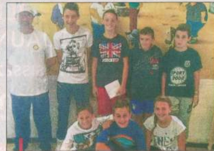
De nombreux enfants ont déjà pris part à l'école de pétanque.

Tous les samedis matins, de 9h30 à 12h30, initiation et perfectionnement à la pétanque pour les jeunes au boulodrome.