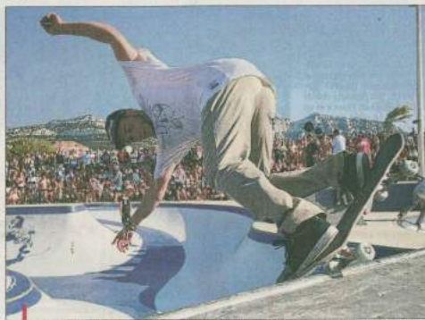
Le skate-park de Carry permettra aux amateurs de tenter de réaliser ce genre de figure de haut niveau.