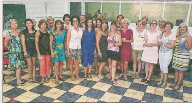
Les membres de Tonic Form Club se retrouvent avec plaisir lors des cours et des activités de l'association.