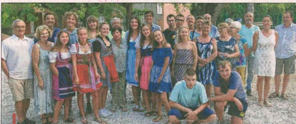
La délégation allemande, les familles d'accueil et les responsables du Comité de Jumelage.