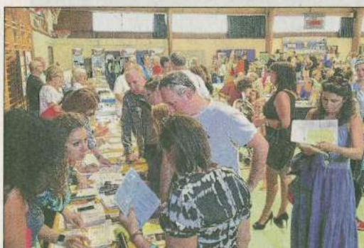
Le forum a lancé la nouvelle année associative et attiré de nombreux visiteurs au gymnase.

Le forum des associations, événement incontournable de la rentrée carryenne, s'est déroulé avant-hier au gymnase, en raison du fort mistral.