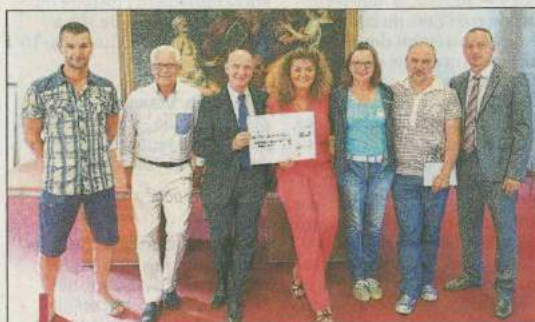
La somme récoltée par l'association servira à financer le reboisement de la Côte bleue.