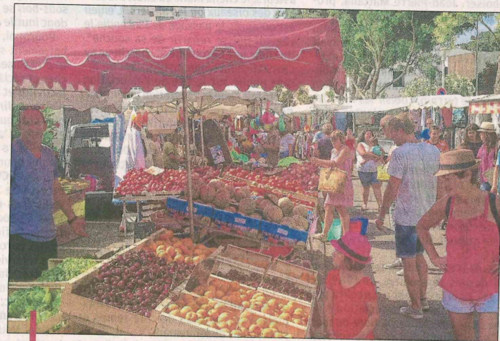
Fruit, légumes, mais aussi paniers, maroquinerie... on trouve de tout à Carry.

Le marché estival est des plus animés et attractifs pour le bonheur des tou-