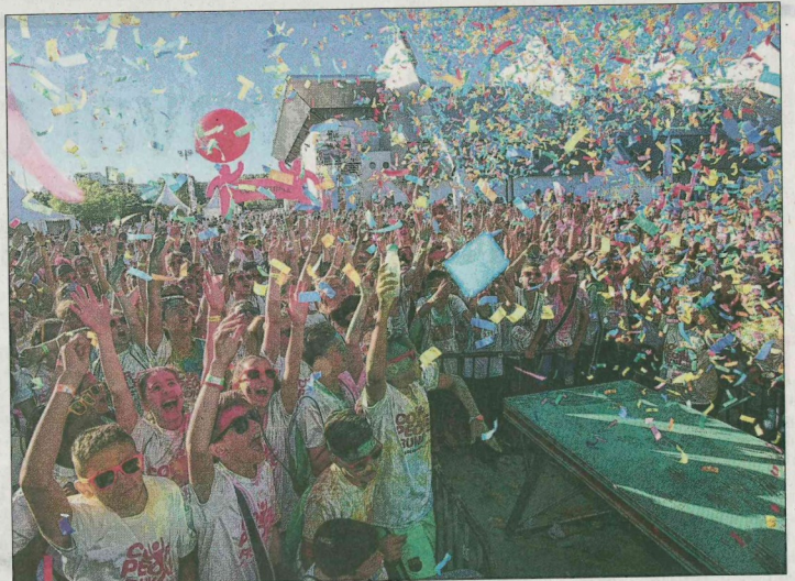
Déjà 400 personnes sont inscrites pour la première édition de la Color people run qui se déroule aujourd'hui à Carry.

Chaque coureur recevra un pack de départ comprenant une paire de lunettes, un bracelet, un tee-shirt, un dossard, un t-shirt éphémère et un sachet de poudre colorée, histoire de pimenter le rendez-vous et de le