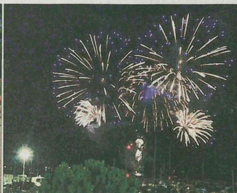
Les boulistes se sont affrontés lors du grand prix de pétanque de la ville, tandis qu'en soirée, le feu d'artifice a ébloui les visiteurs.

Le traditionnel concours de pétanque de la ville de Carry-le-Rouet vient de se dérouler ce mardi 15 août (triplettes choisies), sur les terrains du boudrome municipal. Quarante-six équipes (soit 138 huit joueurs) venues de toute la région voir d'ailleurs y ont pris part. Des boulistes de haut niveau avec des gagnants et finalistes de la Marseillaise et du Provençal qui étaient présents.