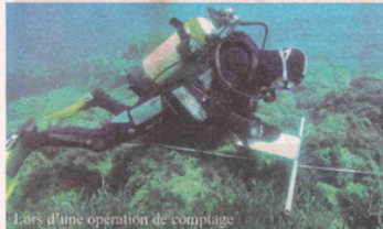
Lors d'une opération de comptage

L'oursin violet, appelé aussi châtaigne de mer ou Paracentrotus lividus, est celui que l'on mange lors des traditionnelles oursinades. Il peut effectivement être violet mais aussi brun ou verdâtre. Cet animal herbivore, qui peut vivre jusqu'à 50 ans, se nourrit principalement d'algues et de Posidonie. On le trouve près de la surface et jusqu'à 80 mètres de profondeur, dans l'herbier de Posidonie ou sur les rochers. Il est présent en Méditerranée mais aussi sur les côtes atlantiques. Les pêcheurs professionnels et les scientifiques du